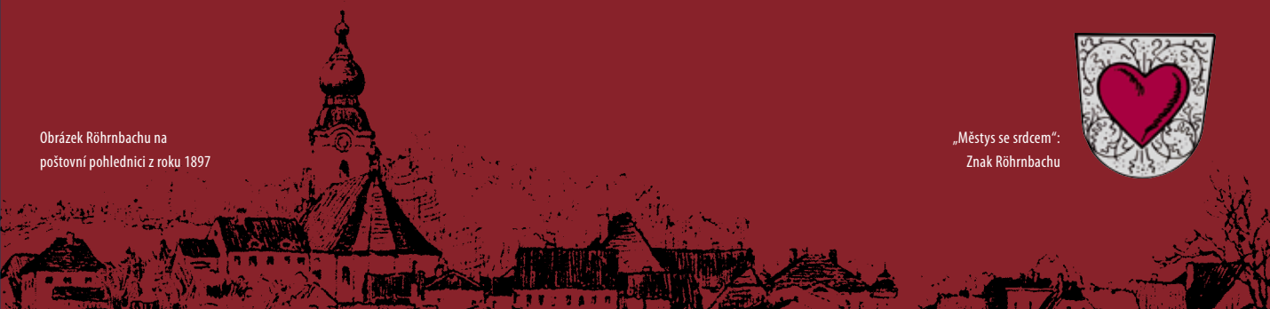
„Městys se srdcem“: Znak Röhrnbachu